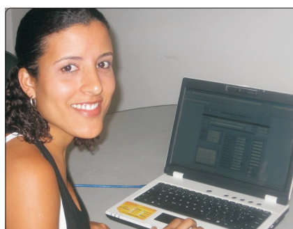
Lexandra desenvolveu um 'Módulo de Treinamento Online sobre conceitos, ferramentas e técnicas de Gerenciamento de Projetos', que será concluído no final do período letivo.

As inscrições começam agora, mas a seleção só acontece no primeiro semestre de 2010 e a bolsa será válida para o segundo semestre do mesmo ano.